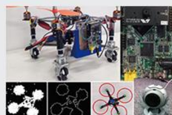
画像処理・ロボティクス研究室 プレーマチャンドラ チンタカ