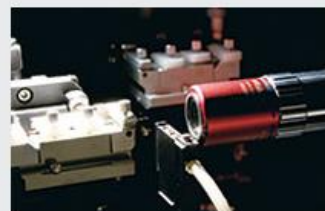
集積光デバイス研究室

所属学会：电子信息通信学会/应用物理学会/IEEE Photonics Society/Electrochemical Society