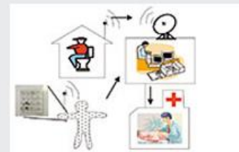
生命情報電子研究室